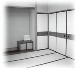
きょうようぶんかしつ 教養文化室