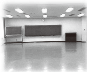
かいぎしつ 会議室・ けんしゅうしつ 研修室