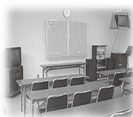
しちょうかく 視聴覚・ おんがくしつ 音楽室